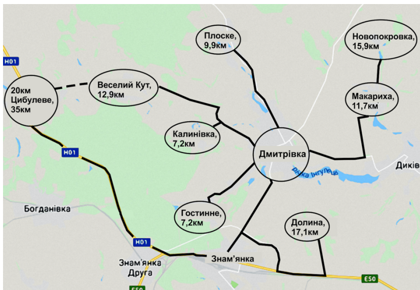
Дмитрівська ОТГ: відстані від сіл до центру громади.

Дмитрівська ОТГ була створена шляхом об'єднання досить великої Дмитрівської сільської ради з маленькою Макариською сільською радою. Це відбулося в листопаді 2017 року, а наприкінці 2018-го про бажання приєднатися заявила Цибулівська сільська рада. Формально