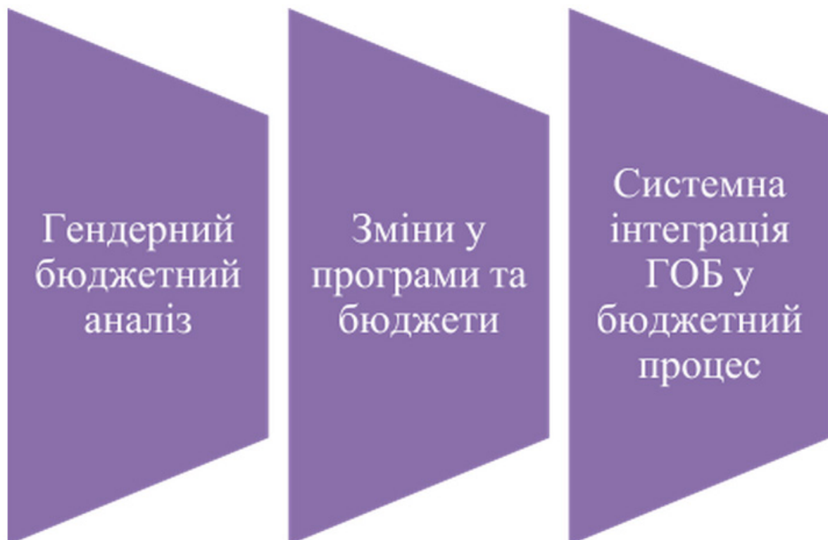
Рис. 1. Основні компоненти роботи з ГОБ

Гендерно-орієнтоване бюджетування – це метод, який передбачає комплексну роботу з інтеграції гендерних аспектів у всі етапи процесу планування. Основні компоненти роботи з ГОБ представлено на рис. 1.